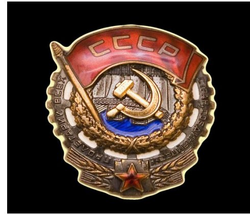
Орден трудового красного знамени