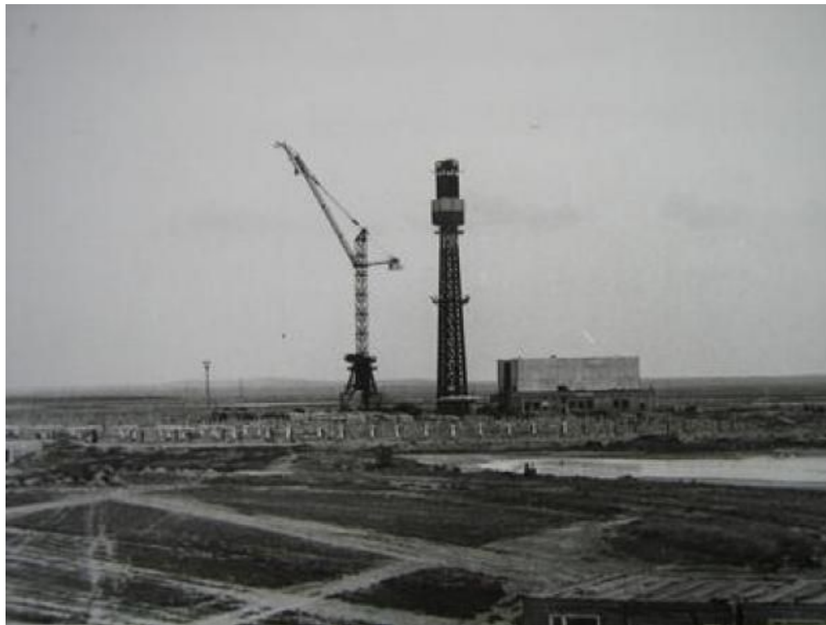
Первая советская солнечная электростанция.

Кржижановский Г.М. Приложил много усилий для привлечения деятелей науки к разработке важных народно-хозяйственных проблем. Первые советские электростанции сооружались при его непосредственном участии.