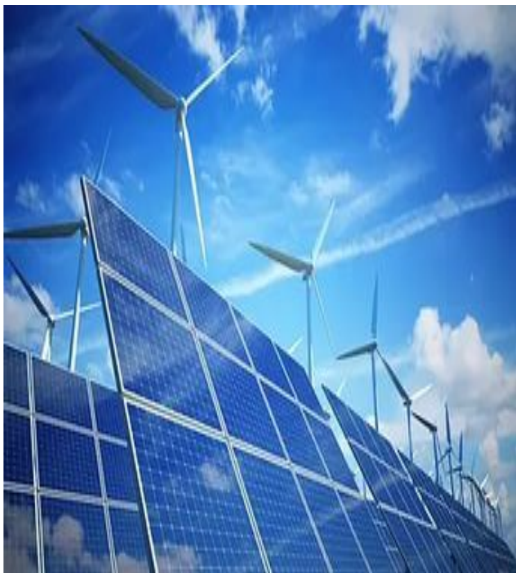
Ветровые и солнечные электростанции

Глеб Максимилианович Кржижановский предвидел большие возможности использования солнечной и ветровой энергии. Он думал, что удобнее использовать реки и озера, чтобы получить энергию и электричество.