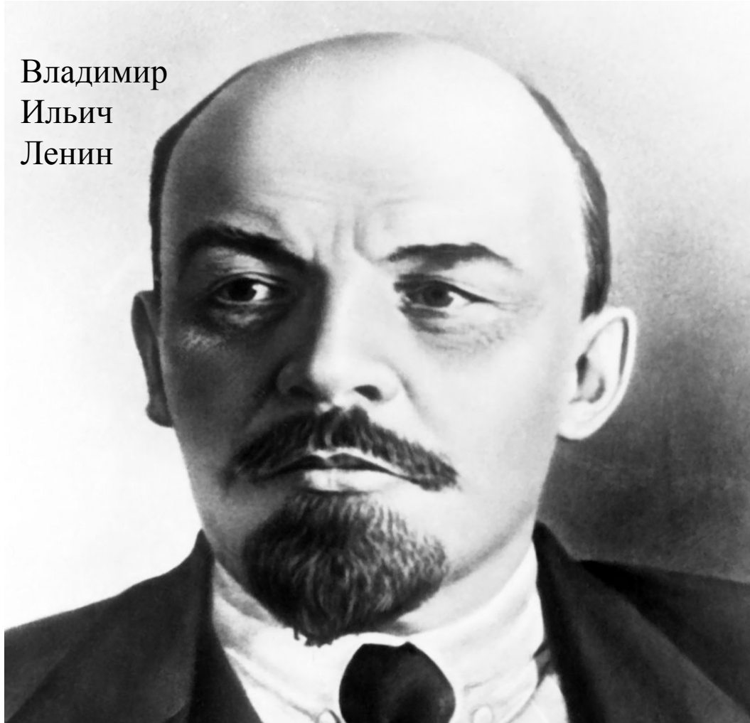
Владимир Ильич Ленин

В 1893 году он познакомился с В.И. Лениным и участвовал в создании «союза борьбы за освобождение рабочего класса».