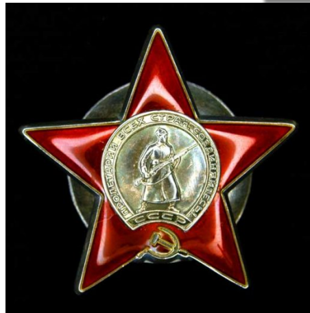
Орден Красной звезды