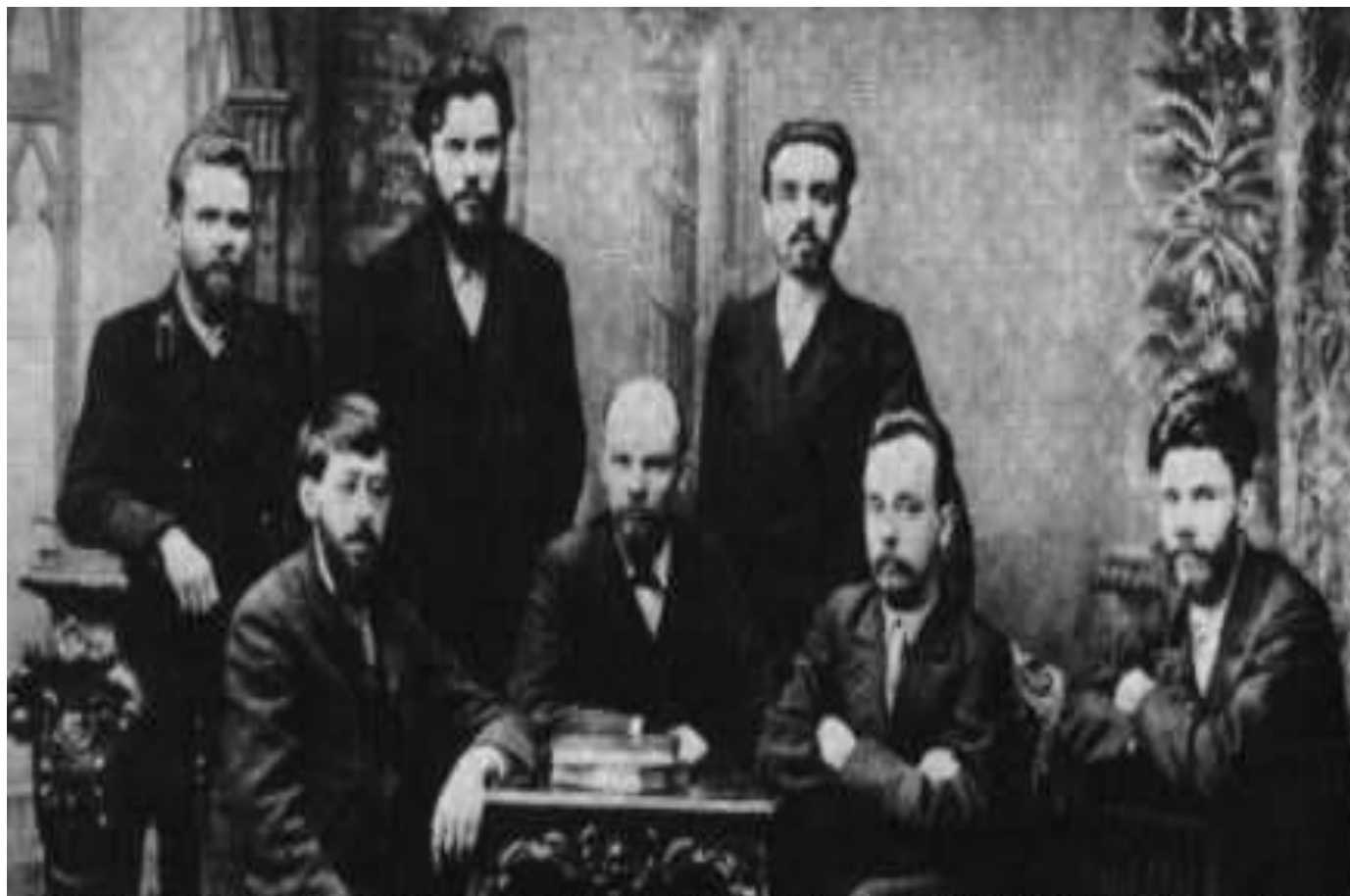
Социал – демократическая группа Кржижановского

После института некоторое время работал в Нижнем Новгороде инженером по кустарным промыслам и принимал участие в деятельности нижегородской Социал – демократической группы.