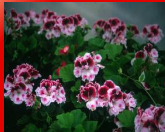
с короткими стеблями