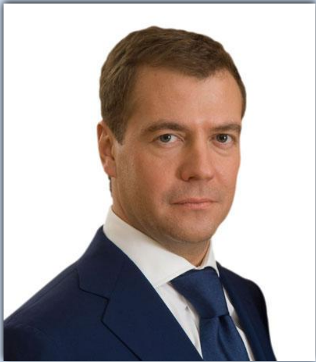
Д.А. Медведев Президент РФ

Мы в России всегда уделяли и будем в дальнейшем уделять самое серьезное внимание развитию национальных культур. Каждый народ , каждая маленькая этническая группа должна чувствовать себя в России комфортно, должна понимать, что это ее родной дом.