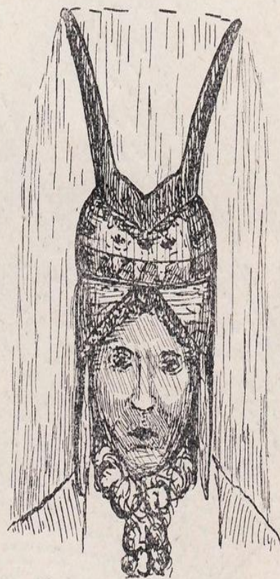
Рис. 15. Рогатая кичка — налево донской казачки (по рис. 1778 г.), направо „некрасовской казачки“ (по фот. 1895 г.)