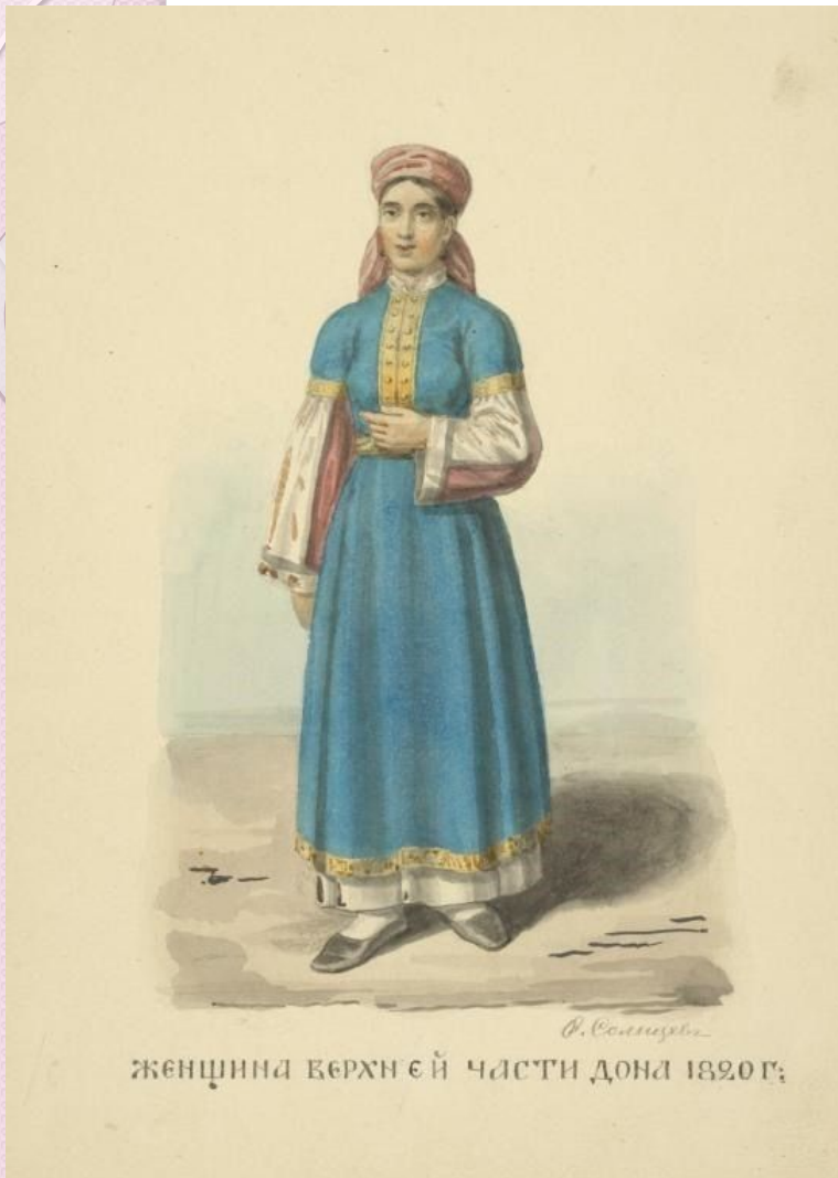
женщина Верхней части Дона 1820 г.