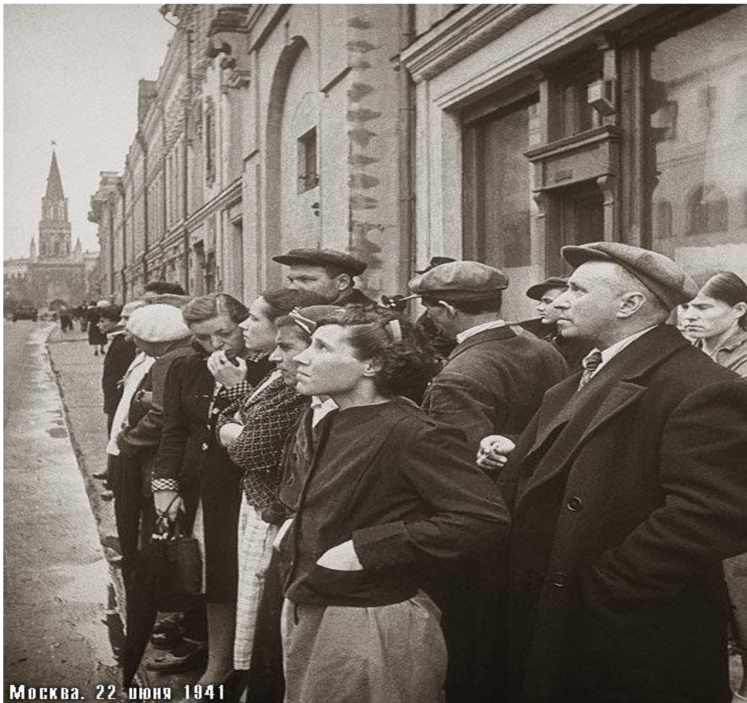
Москва. 22 июня 1941