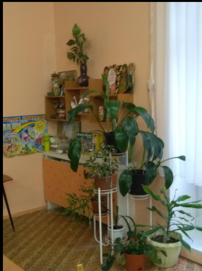
2.2.5. Активный сектор