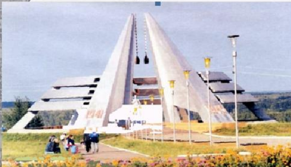
Мемориал – 30 лет Победы в ВОВ, 1975 г. Скорбящая мать была воздвигнута в 1985 г.

Монумент «Героям гражданской войны» в честь 60-летия освобождения Кузбасса от колчаковцев.