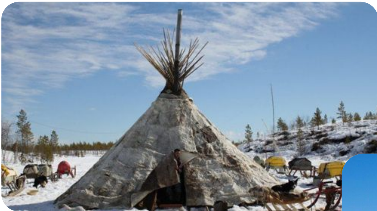
Жилище хантов и манси-чум