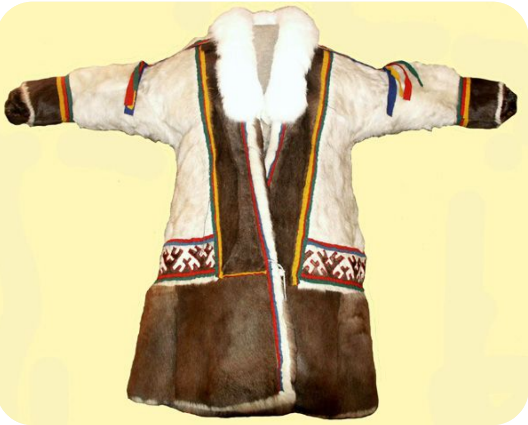
Национальная одежда- малица