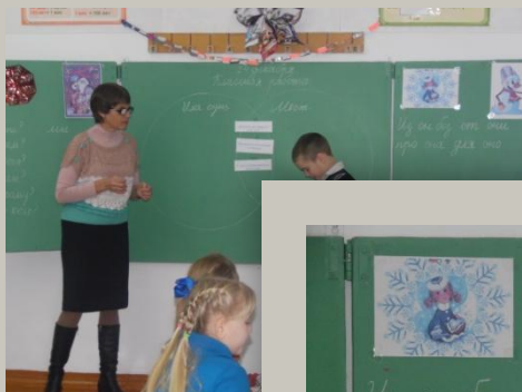
«Новогодний калейдоскоп» 4 класс