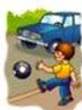
Игра на сферен топка