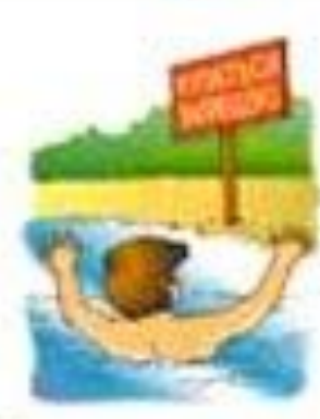
Купане и сончогревна лампа