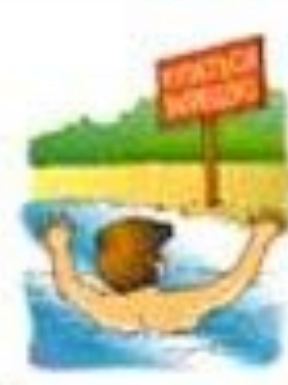
Купается в загрязненном водоеме