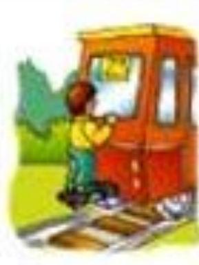
Катерца и влак станица