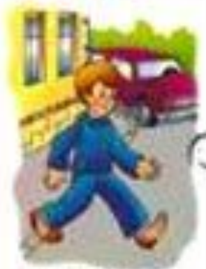
Пешачен знак и пешачки прелези