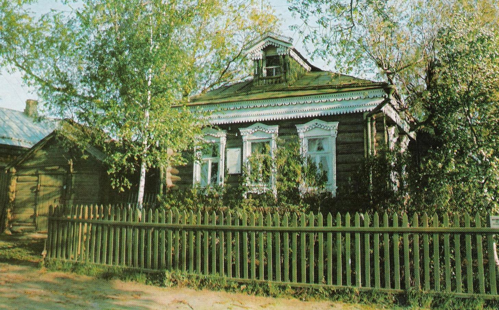
Дом Есенина, где родился и жил поэт.