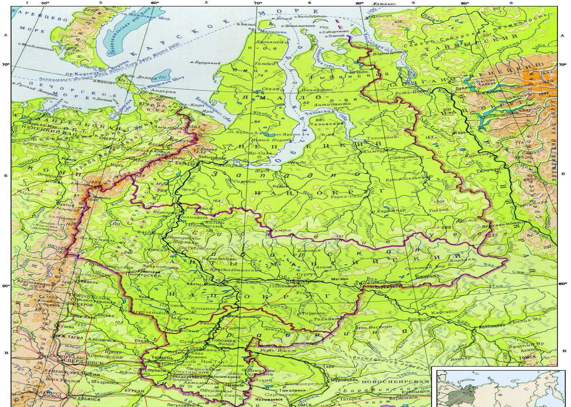
ШКАЛА ГЛУБИН И ВЫСОТ В МЕТРАХ