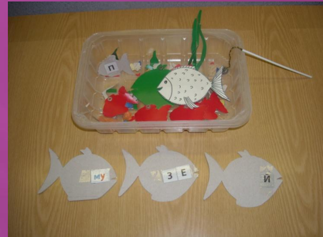
Дидактическое пособие «Рыбалка»