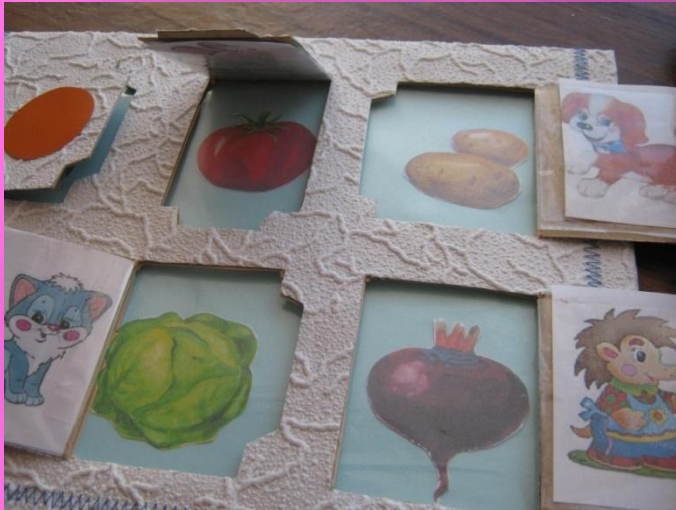
Дидактическое пособие «Чудо – домик» (описание предмета)