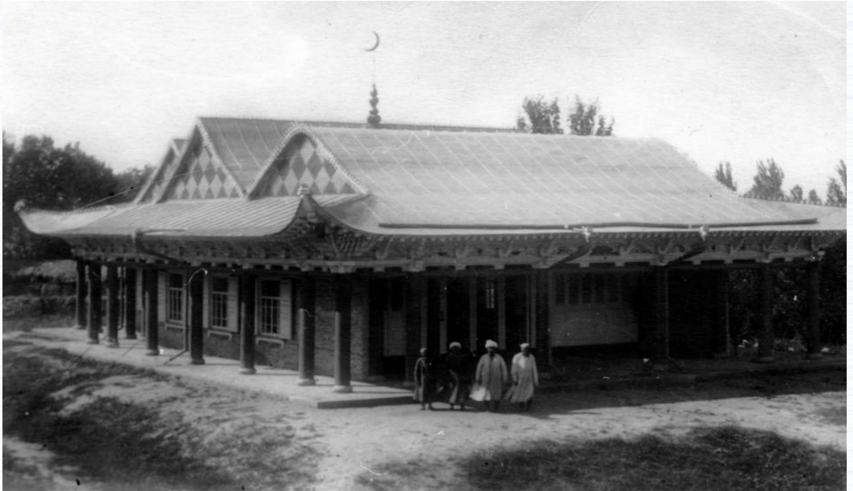
Дунганская мечеть. Снимок 1930 года