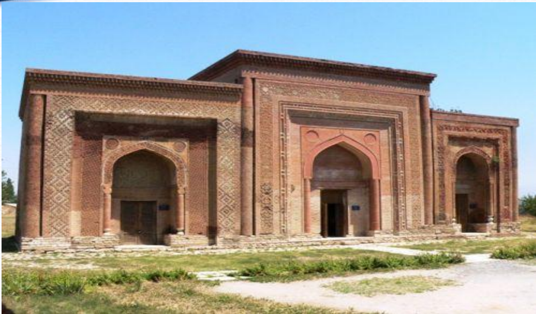
Узгенский мавзолей. Фото 1970 года