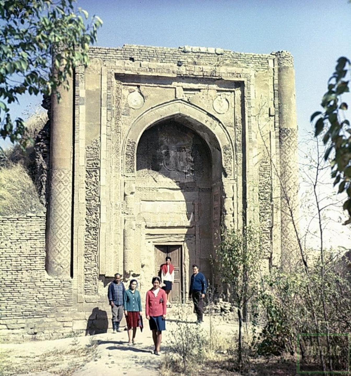
Вход в Южный мавзолей. Фото 1968 года