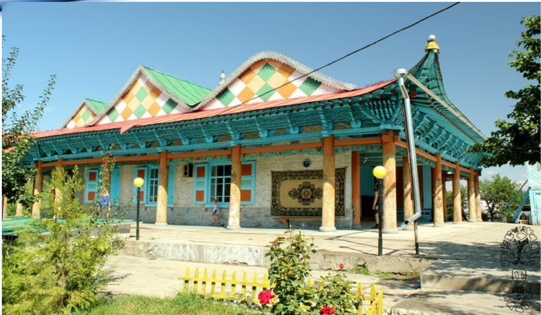
Дунганская мечеть, которая построена без единого гвоздя