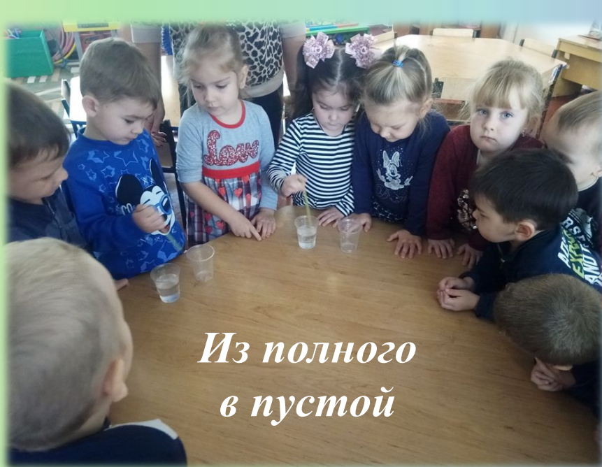
Из полного в пустой