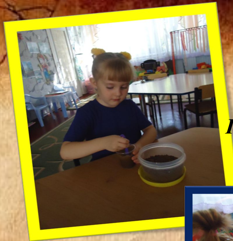
Поиграем мы с землей – многое узнаем о ней