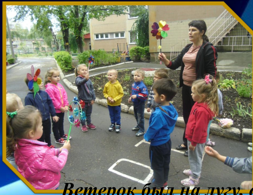
Ветерок был на лугу, дуть я тоже так могу.