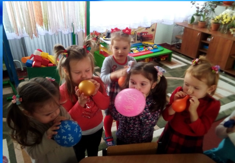
Воздух вокруг нас