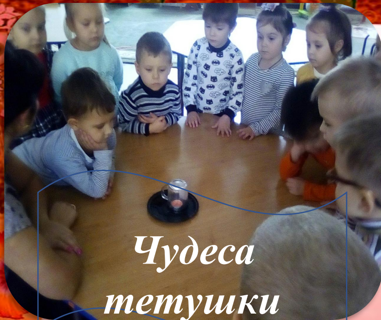
Чудеса тетушки свечки