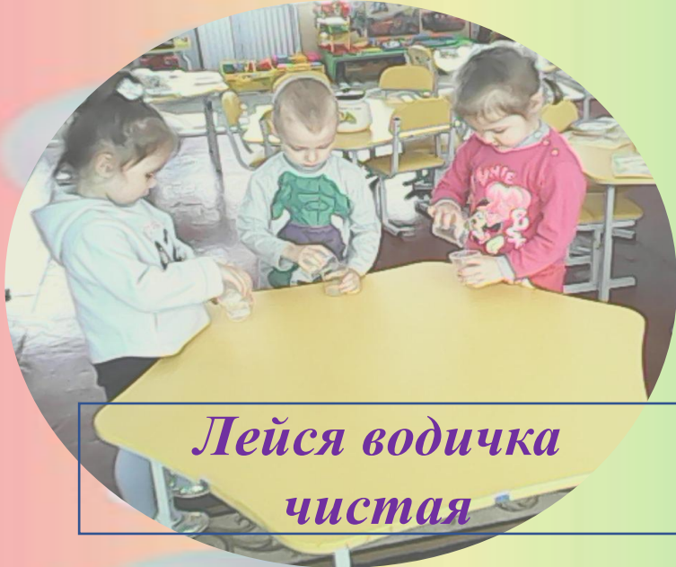
Лейся водичка чистая