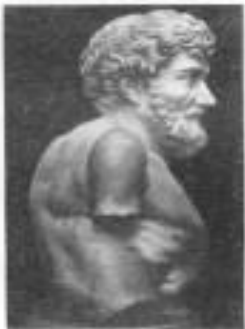
Эзоп — древнегреческий баснописец. Мрамор. VI в. до н. э. Вилла Албани.