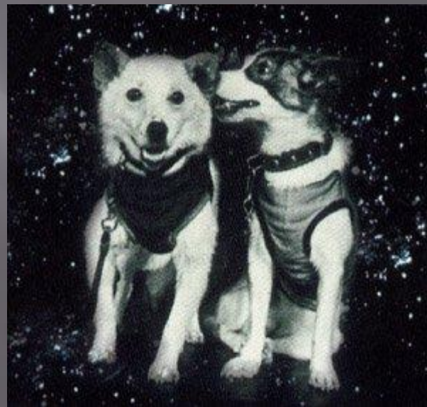
БЕЛКА И СТРЕЛКА