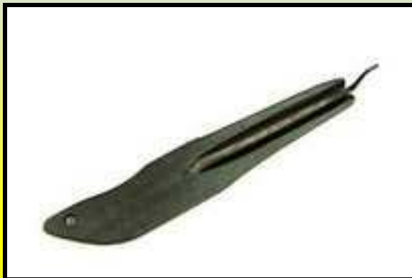
японский бамбуковый бамыр