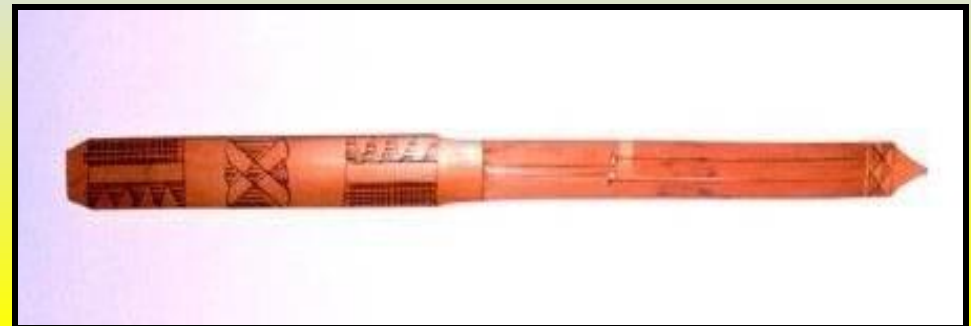
филлипинский деревянный кубыз