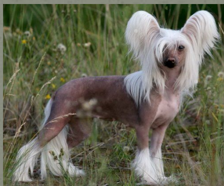
Китайская хохлатая собака