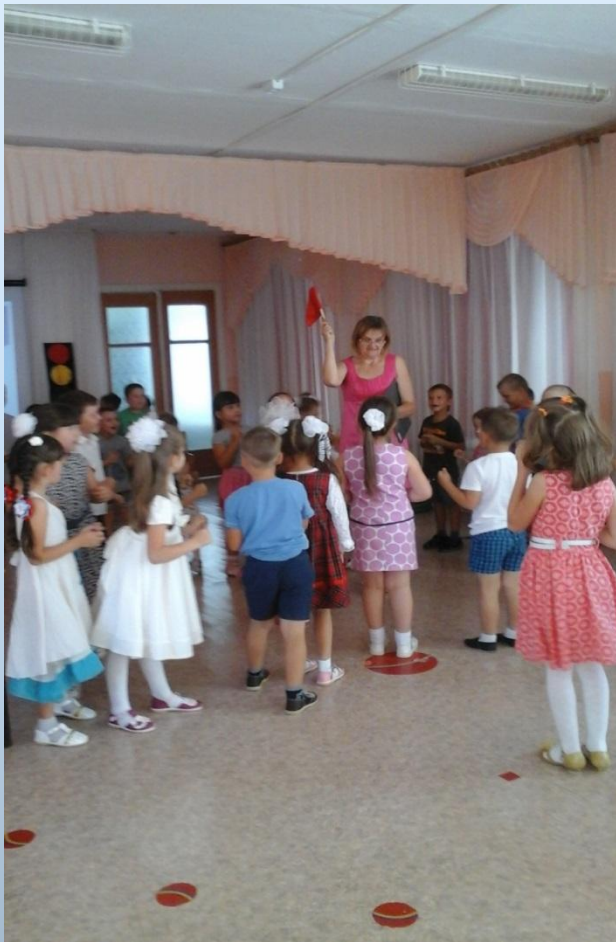
Подвижная игра: «Регулировщик»