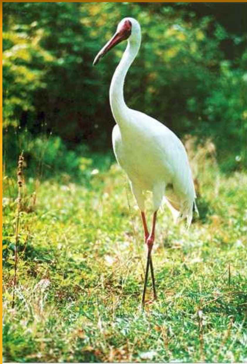
стерх, белый журавль