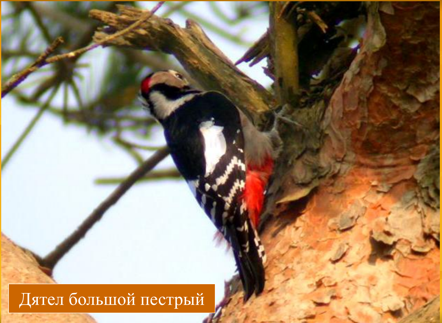
Дятел большой пестрый