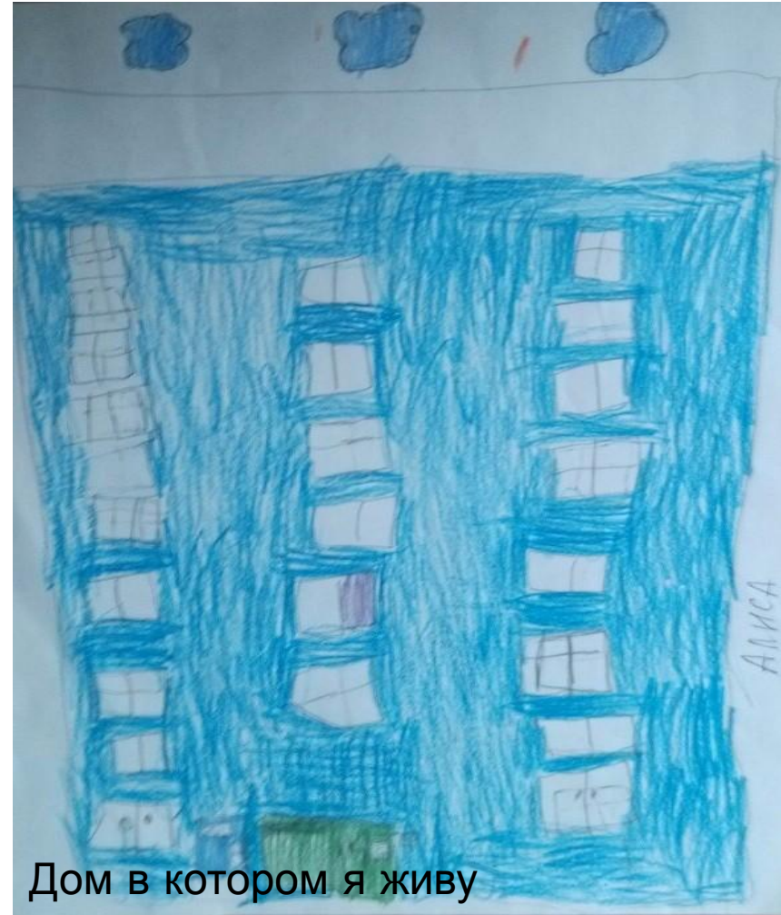
Дом в котором я живу