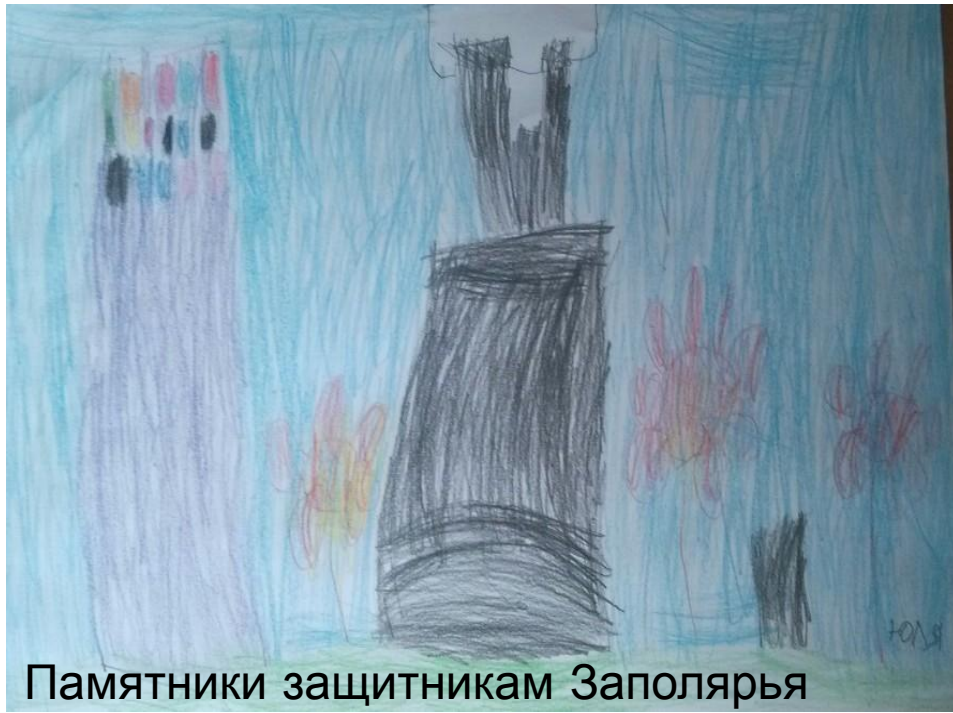
Памятники защитникам Заполярья