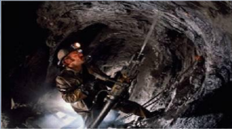
Уголь добывают в шахтах.