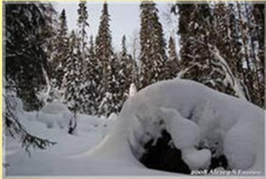
В берлоге живет... (Кто?)