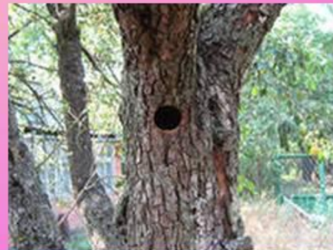
В дупле живет... (кто?)