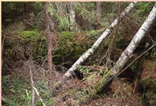
В логове живет... (Кто?)