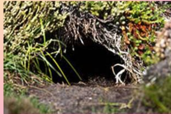
В норе живет... (Кто?)