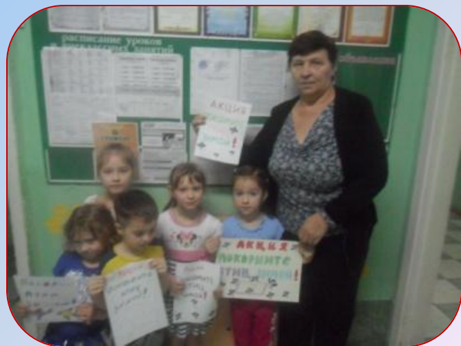
В методическом кабинете