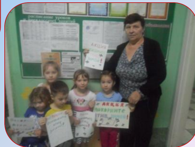
В методическом кабинете