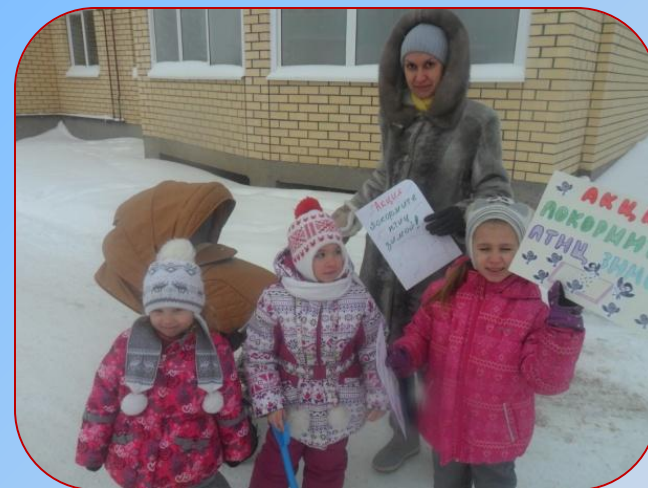
Прохожие охотно берут наши листовки и хвалят детей