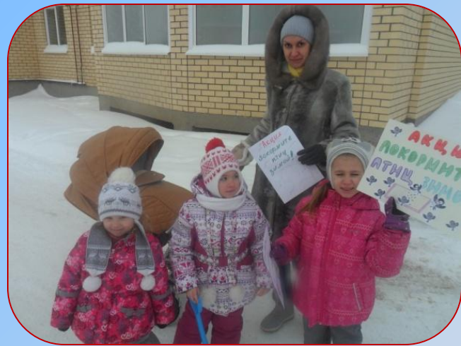
Прохожие охотно берут наши листовки и хвалят детей