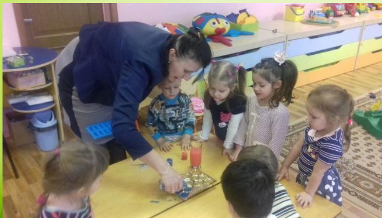
Опыт «Цветная вода»