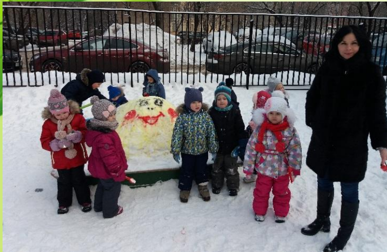
Опыт «Цветной лёд»