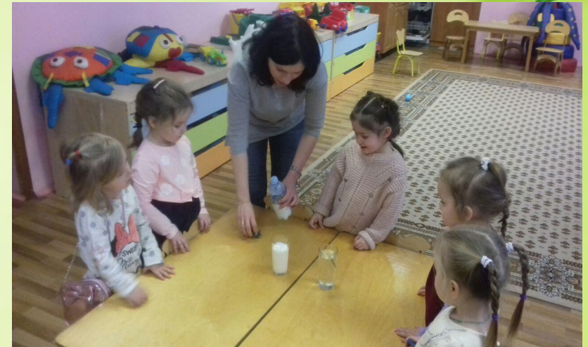
Опыт «Молоко и вода»