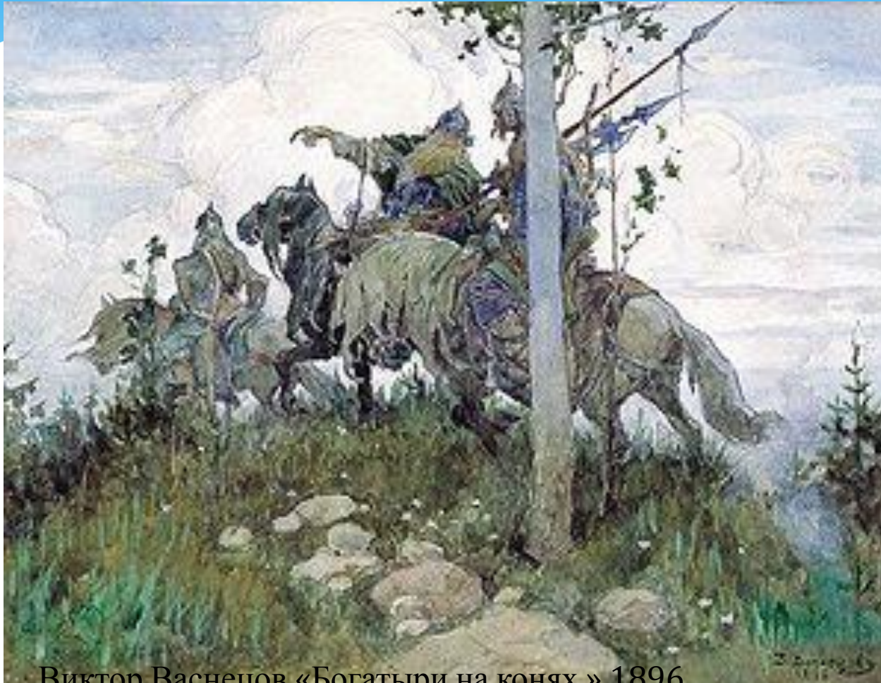
Виктор Васнецов «Богатыри на конях.» 1896

-это герои русских былин, совершавшие подвиги во имя Родины, человек безмерной силы, стойкости, отваги, наделенные необыкновенным умом и смекалкой.