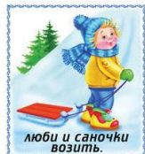
Люби и саночки возить.