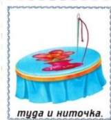
туда и ниточка.

http://www.liveinternet.ru/users/nbnika/