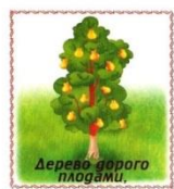
Дерево дорого плодами.