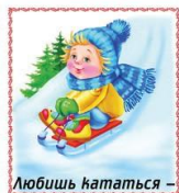
Любшь кататься –