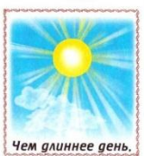
Чем длиннее день,