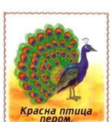
Красна птица пером.