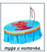
туда и ниточка.

http://www.liveinternet.ru/users/nbnika/