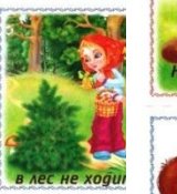
в лес не ходи