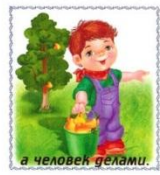
а человек делами.