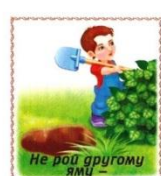
Не рой другому яму –