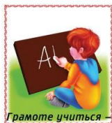
Грамоте учиться –