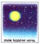
тем короче ночь.