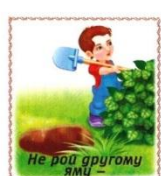
Не рой другому яму –