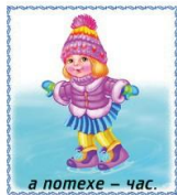
а потехе – час.