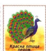
Красна птица пером.