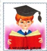
а человек умом.