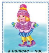
а потехе – час.