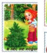
в лес не ходи