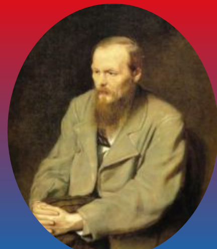
Фёдор Михайлович Достоевский