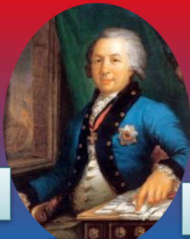
Гавриил Романович Державин