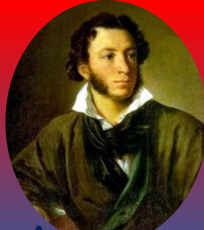
Александр Сергеевич Пушкин