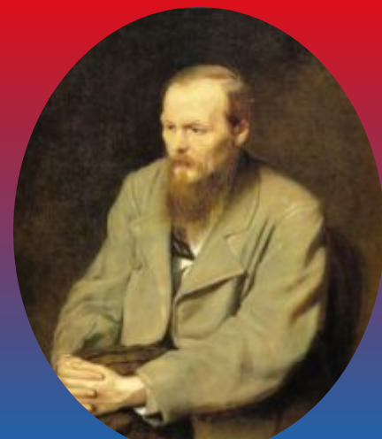
Фёдор Михайлович Достоевский