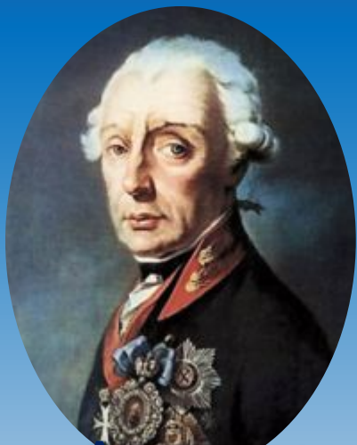
Александр Васильевич Суворов