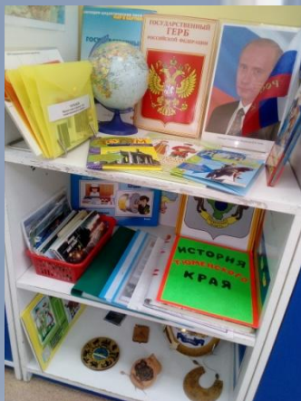
Уголок по патриотическому воспитанию