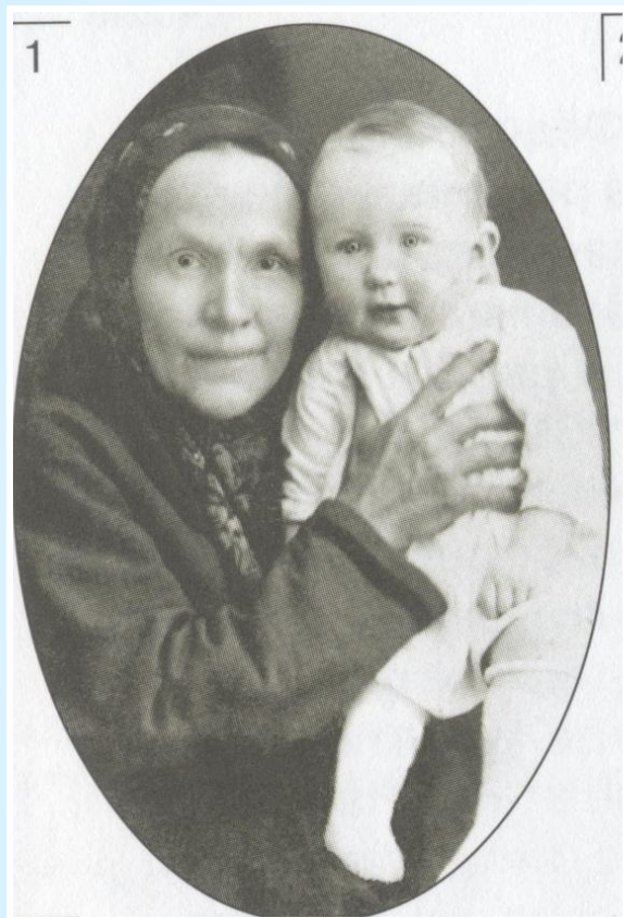
На руках у няни