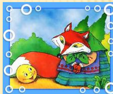
лиси чк а