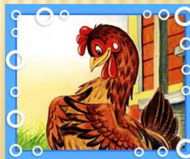
куро чк а Ряба