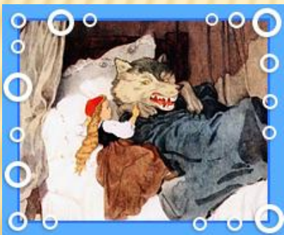
Красная Шапоч к. а