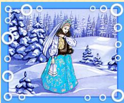
Снегуро чк а