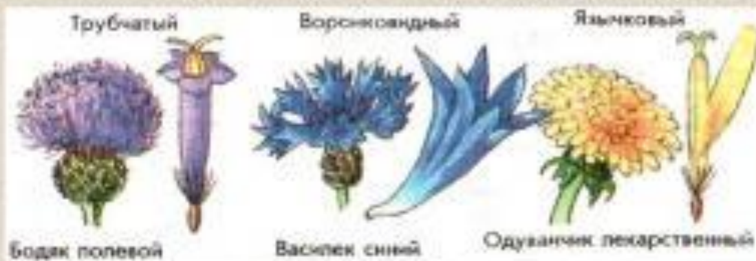
180. Цветки в соцветии корзинки

Цветки – язычковые (одуванчик), трубчатые (бодяк), воронковидные (василек)