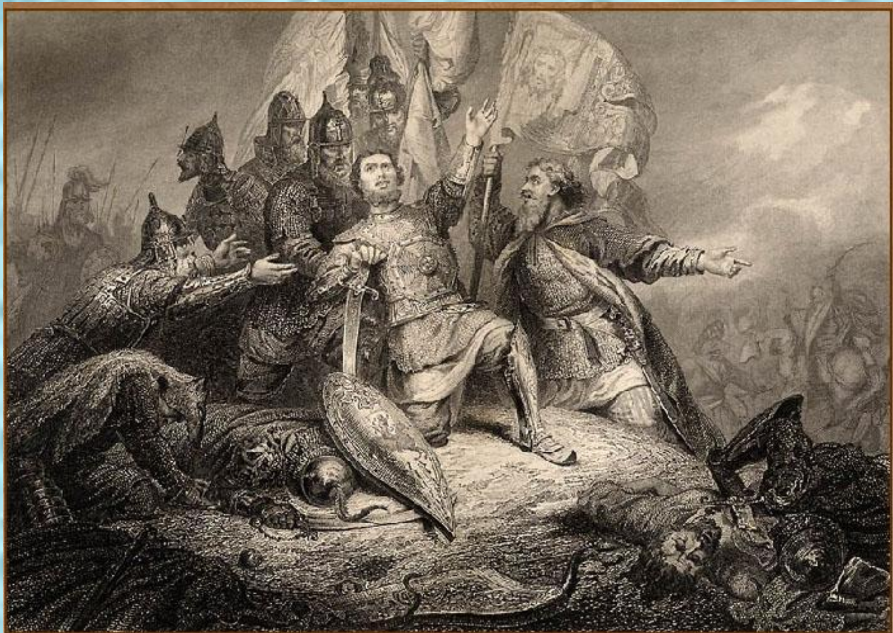
Пожарский в битве под Москвой