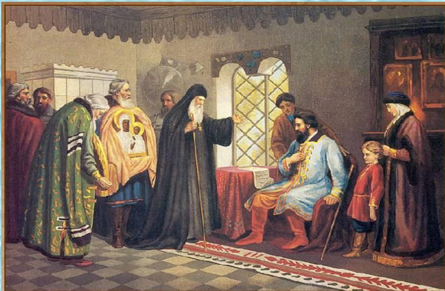
Нижегородские послы у князя Дмитрия Пожарского. 1611 г.

. Военным руководителем ополчения стал князь Д. М. Пожарский.