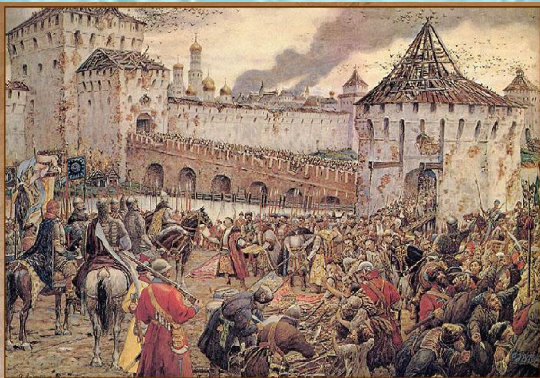
Изгнание польских интервентов из Московского Кремля в 1612 г.