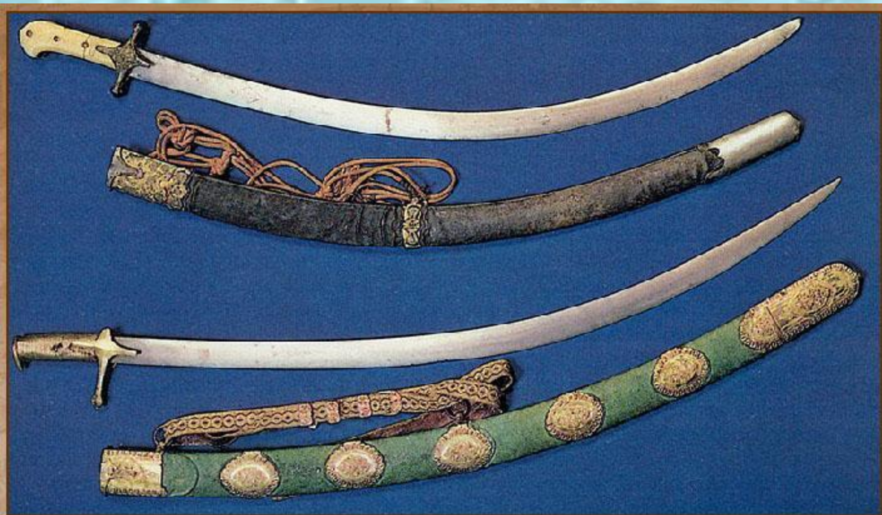
Сабли К. Минина и Д. Пожарского