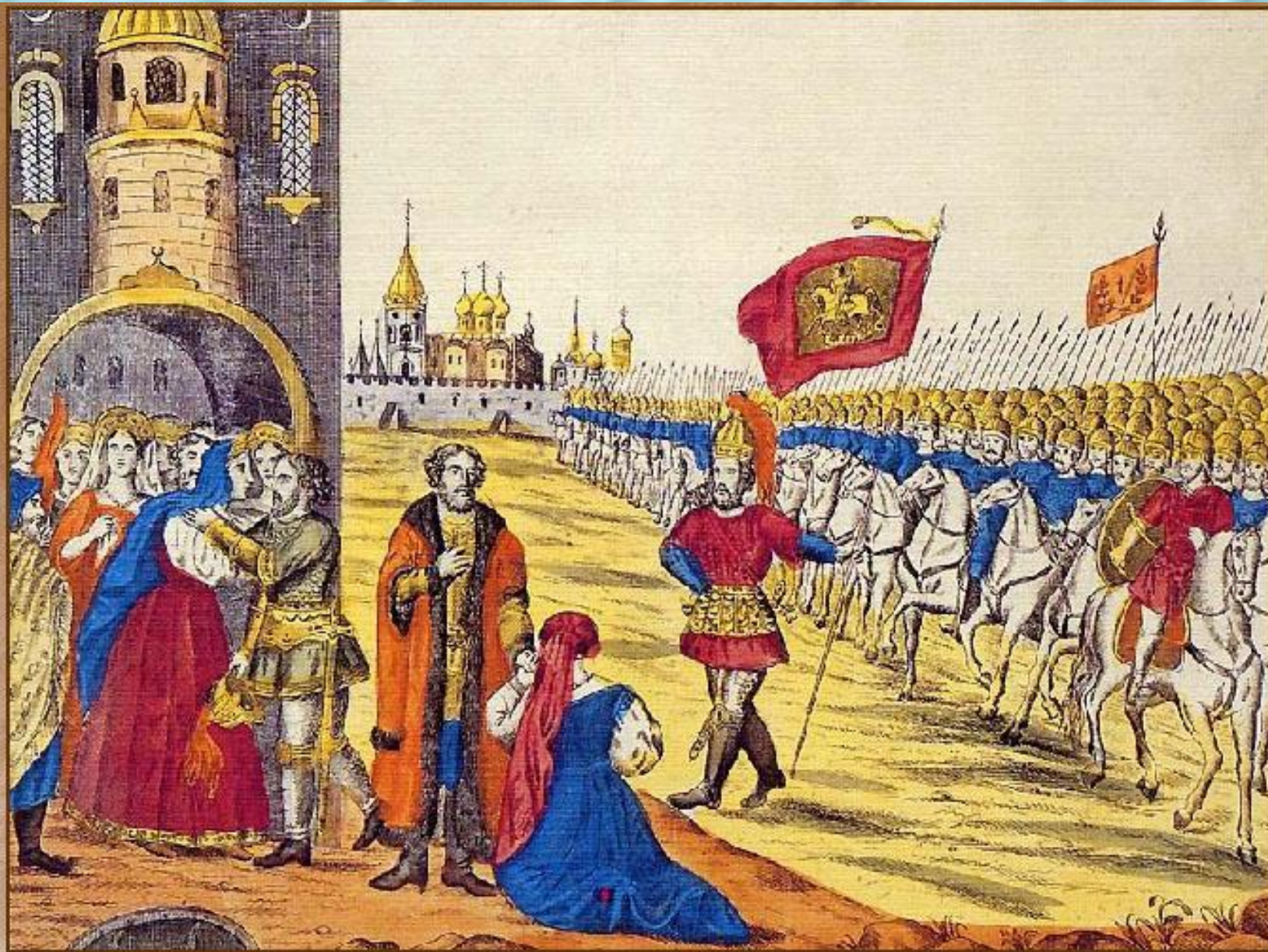
Гражданин Минин и князь Пожарский