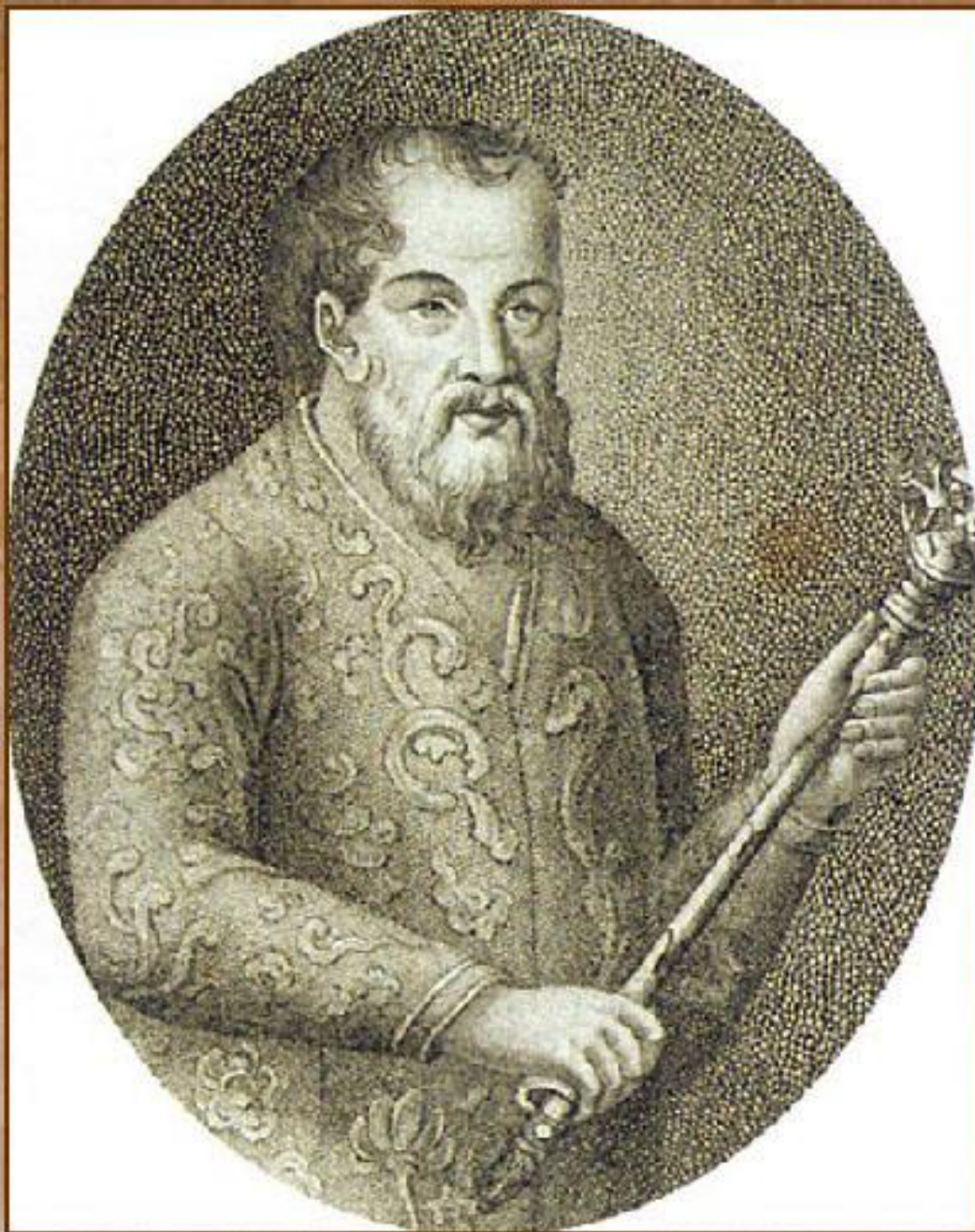
Пожарский Д.М., князь, глава Ямского приказа