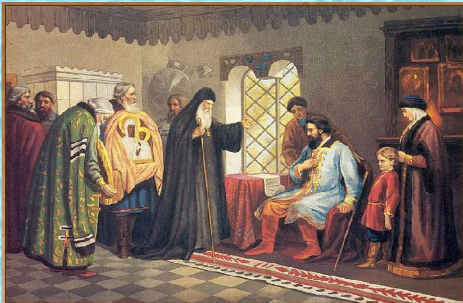
Нижегородские послы у князя Дмитрия Пожарского. 1611 г.

. Военным руководителем ополчения стал князь Д. М. Пожарский.