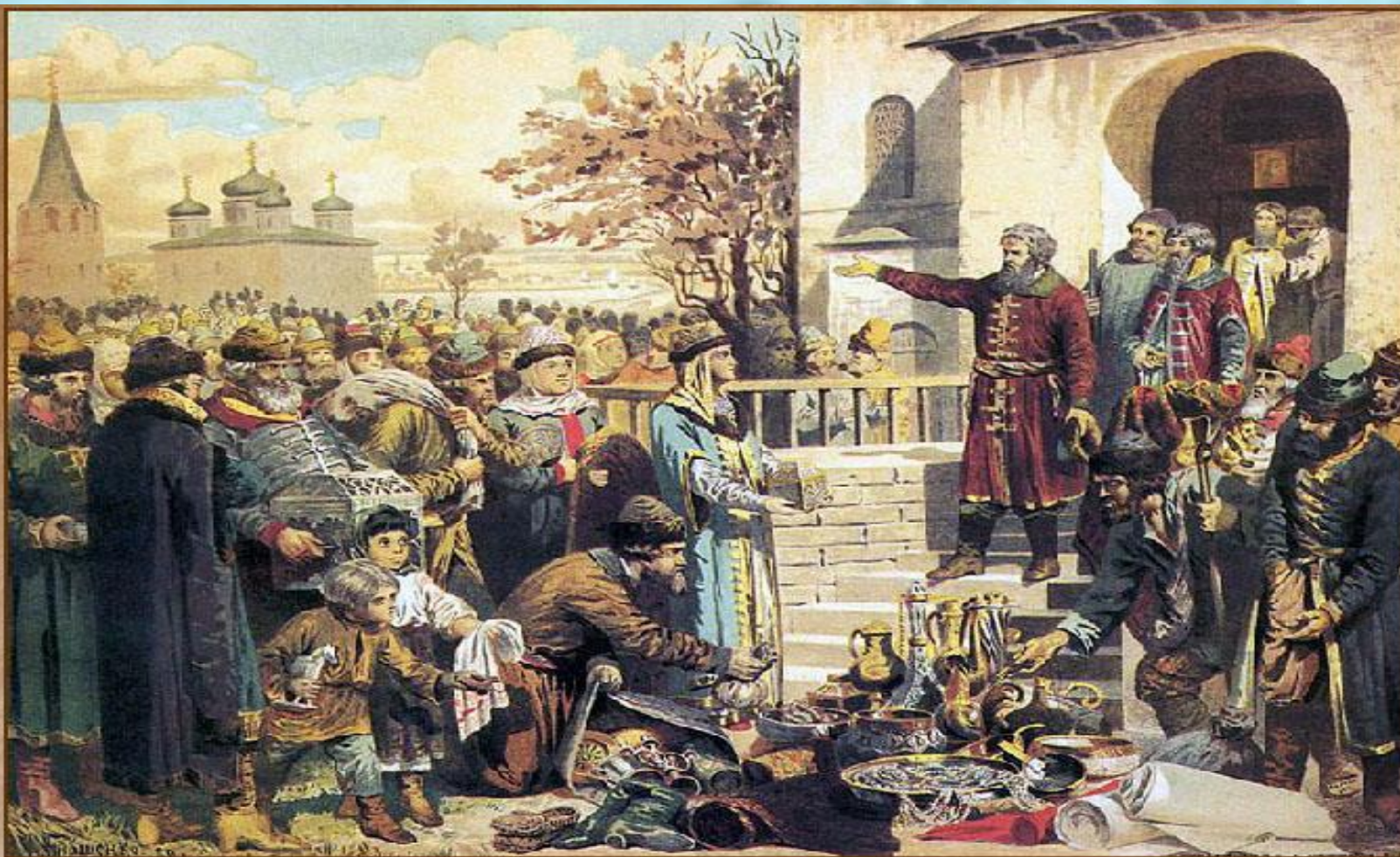
Воззвание Козьмы Минина к нижегородцам