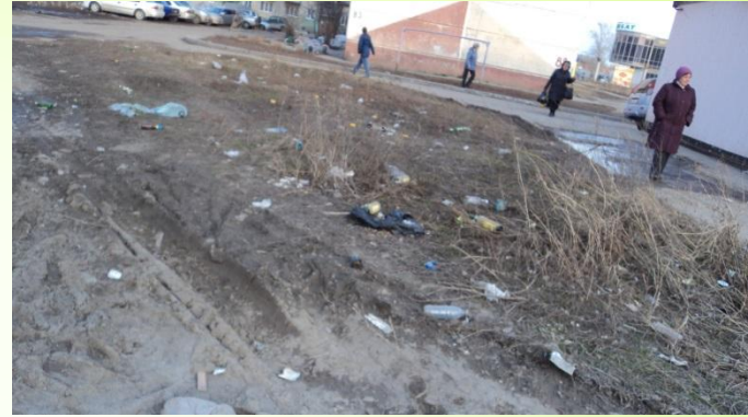
Экологический опрос №1