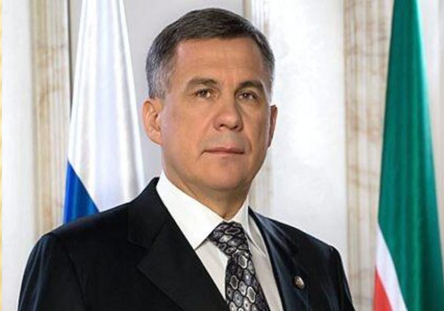
Президент Республики Татарстан Минниханов Рустам Нургалиевич