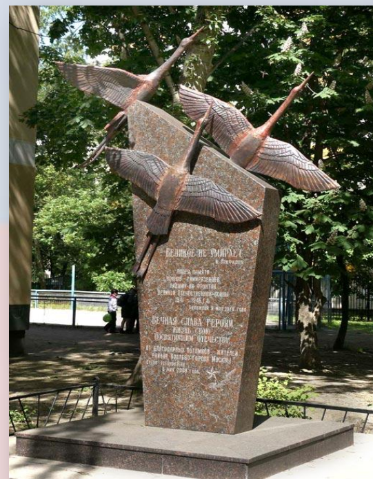
Памятник героям - тимирязевцам