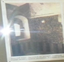
Интерьер соборной церкви в Феофановском монастыре, 17-18 вв.