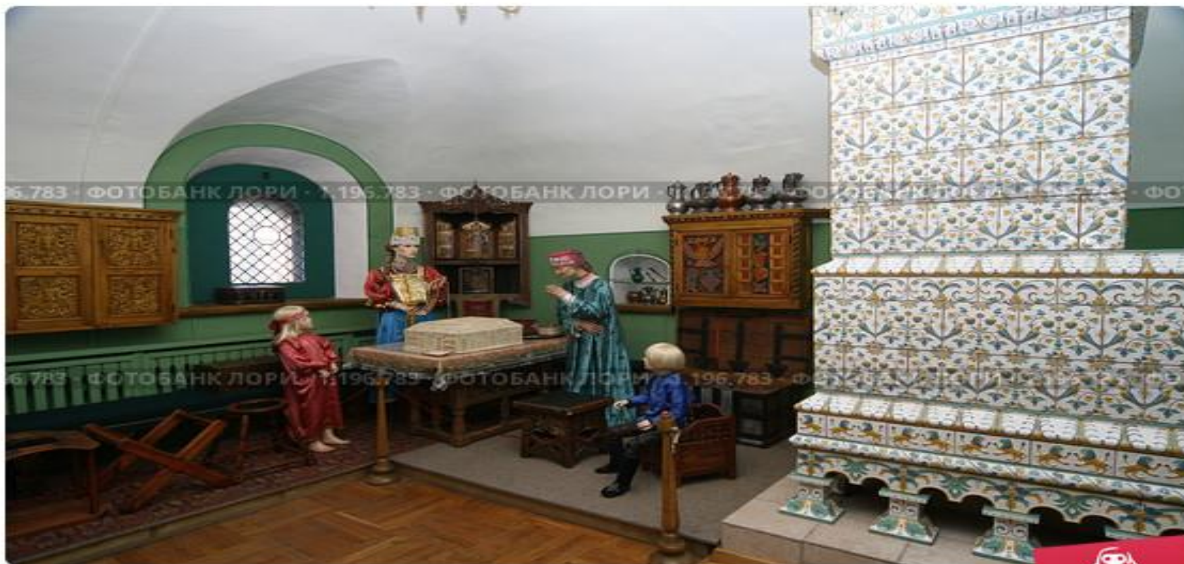
Рязань. Рязанский кремль. Музейная экспозиция «По обычаю дедову»