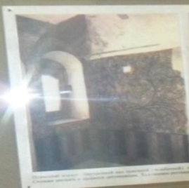
Интерьер соборной церкви в г. Владимир, 12-13 вв.