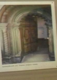
Интерьер соборной церкви в г. Владимир, 12-13 вв.