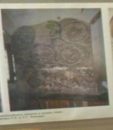
Детали декора соборной церкви в г. Владимир, 12-13 вв.