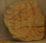
Рельеф. Лицо. 1870-е гг.