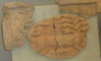
Фрагменты фрески в соборной церкви в Феофановском монастыре, 17-18 вв.

В 1778 году, в соответствии с указом императрицы Екатерины II, в Феофановском монастыре были проведены реставрационные работы. В результате были восстановлены соборная церковь, а также в ней были проведены реставрационные работы. В результате реставрации в соборной церкви были восстановлены фрески, росписи, иконостас, алтарь, амвон и другие элементы интерьера.