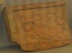
Рельеф. Узор. 1870-е гг.