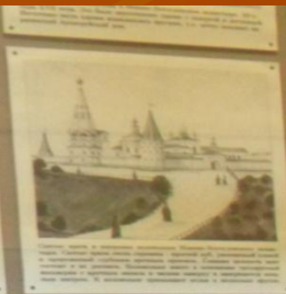
Церковь в Феофановском монастыре, 17-18 вв.