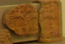
Фрагменты фрески в соборной церкви в Феофановском монастыре, 17-18 вв.