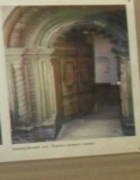
Интерьер соборной церкви в Феофановском монастыре, 17-18 вв.