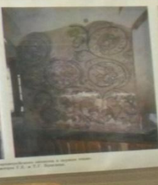
Фрески в соборной церкви в Феофановском монастыре, 17-18 вв.