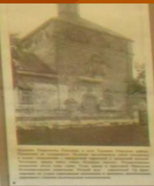
Церковь в Феофановском монастыре, 17-18 вв.