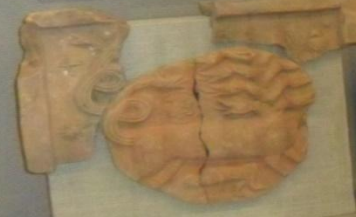
Каменный рельеф с изображением лица, найденный в г. Владимире.

В 1277-1278 гг. владимирские князья, в том числе Александр Невский, основали в г. Владимире Соборную церковь. В настоящее время в ней хранятся ценные предметы старины, в том числе иконы, фрески, мозаики и другие произведения искусства. Церковь является одним из самых красивых и величественных сооружений в г. Владимире.