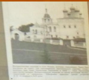
Соборная церковь в Феофановском монастыре, 17-18 вв.