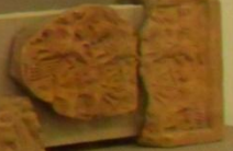
Рельеф. Узор. 1870-е гг.