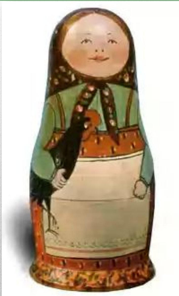
Первая русская матрёшка...