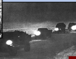
«Зимой машины мчались вереницей И лёд на Ладоге трещал. Возили хлеб для северной столицы, И Ленинград нас радостно встречал.»

Жертвы первых обстрелов на углу Невского и Лиговского проспектов. Сентябрь 1941