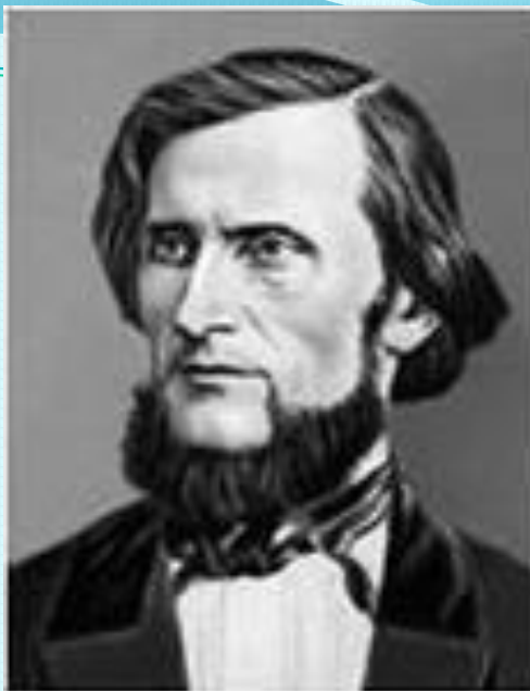
К. Д. Ушинский