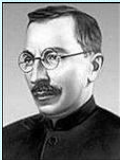
А. С. Макаренко