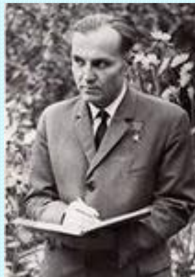
В. А. Сухомлинский