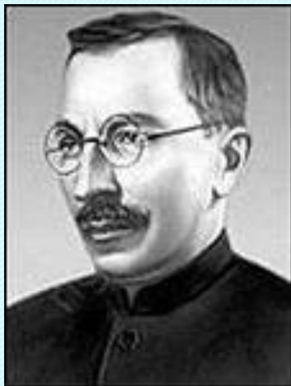
А. С. Макаренко