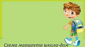
Схема маршрута школа-дом