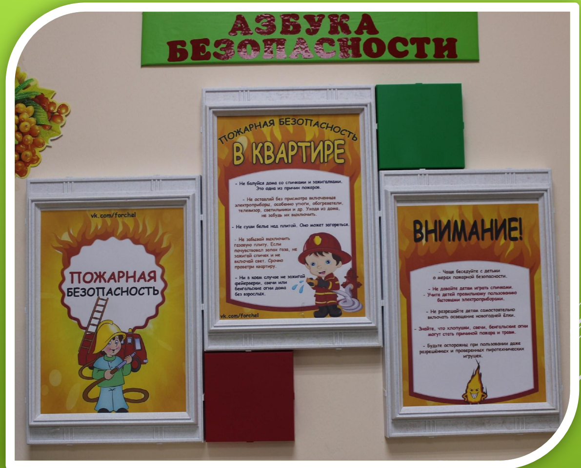
ОФОРМЛЕНИЕ ИНФОРМАЦИИ В РОДИТЕЛЬСКИХ УГОЛКАХ.