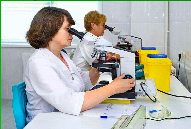
Медсестры в лаборатории