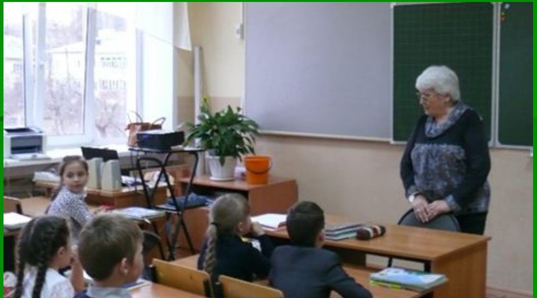
Интересная встреча в классе