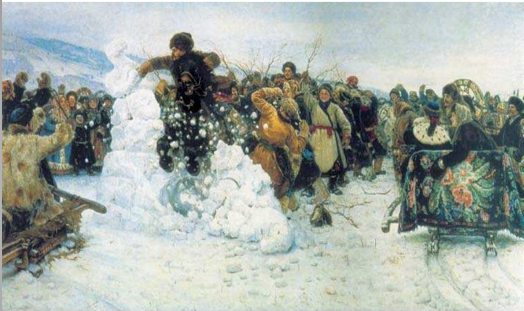
Суриков: Взятие снежного городка