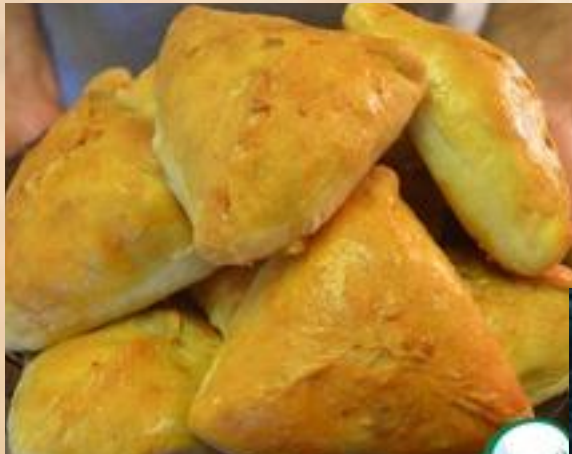
Эчпомчак -в начинку кладут баранину

Татарский плов -особой популярностью у татар пользуется плов