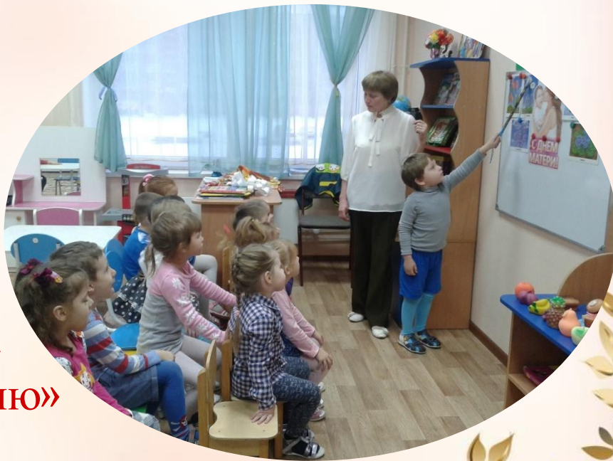
Словестная игра «Маму я свою люблю»