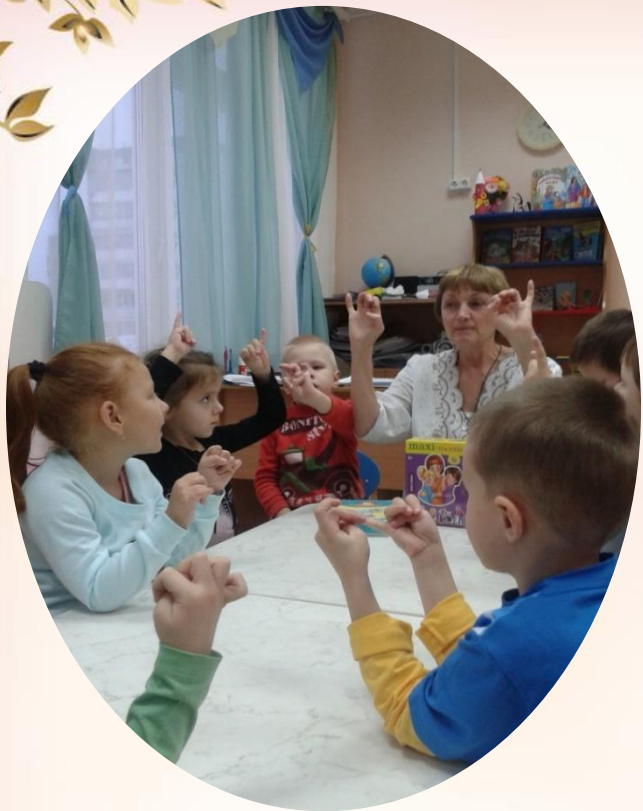
Пальчиковая игра «Наша дружная семья»