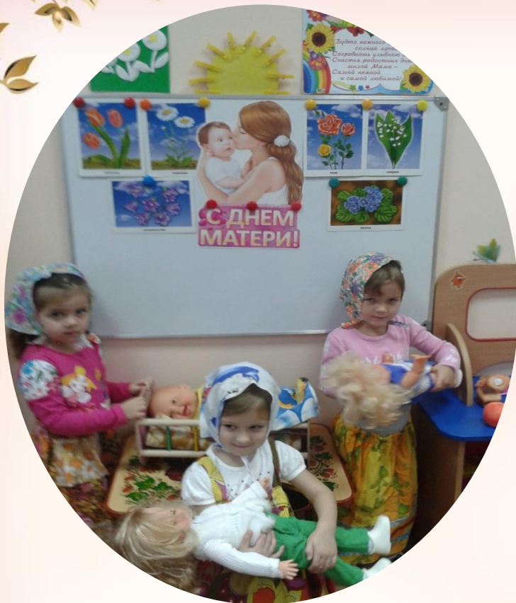
«День рождения Мамы»