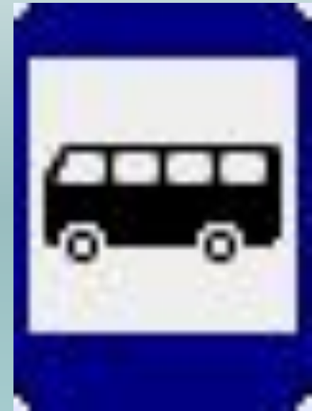
Остановка автобуса, троллейбуса