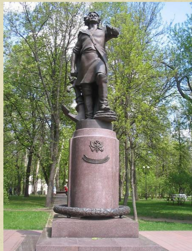
Памятник Петру I в Измайлово (1998)