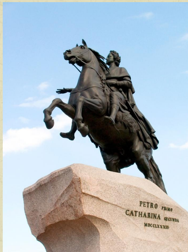
«Медный всадник» в Петербурге (1782)