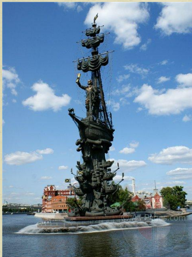
Памятник Петру I в Москве (1997)