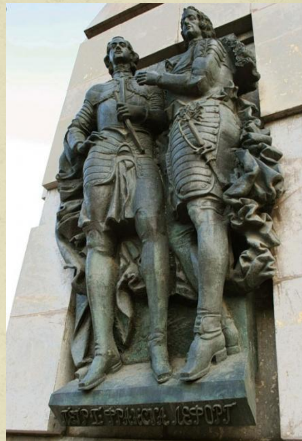
Памятник Петру I и Францу Лефорту в Лефортово