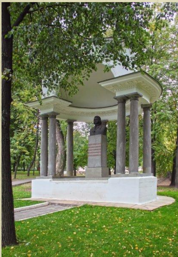
Памятник-бюст Петру I в Лефортовском парке