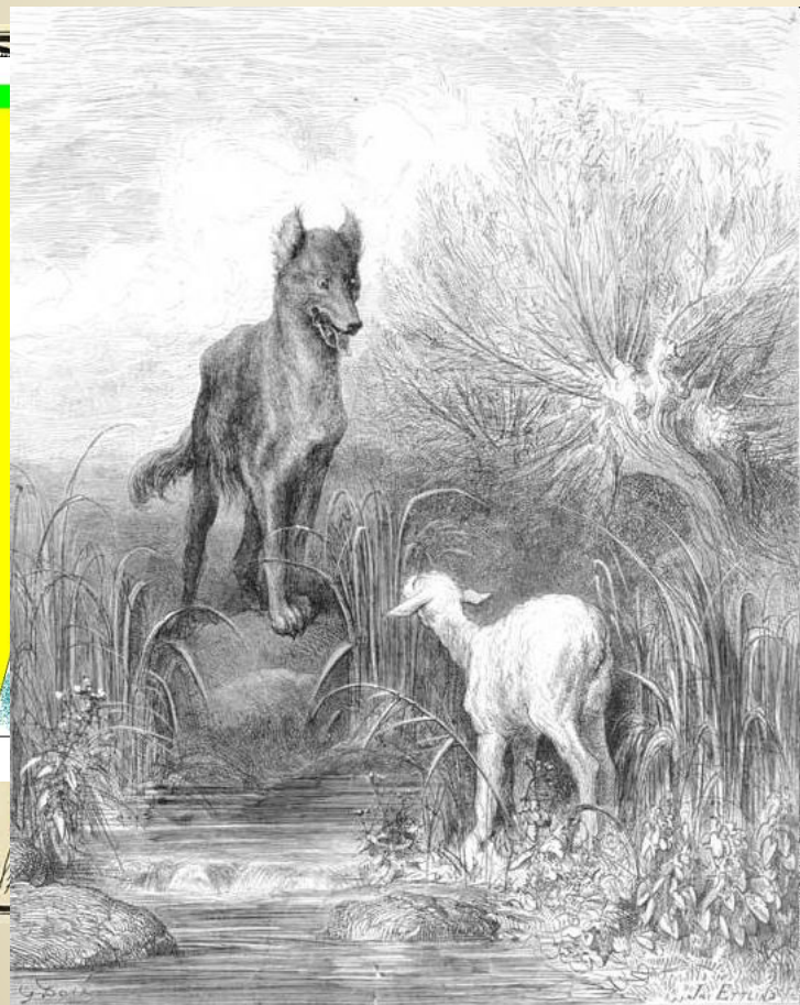
«Лисица и агнец»